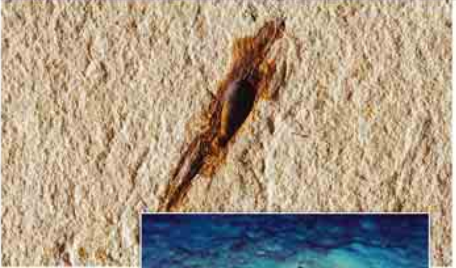
Mürekkep Balığı Dönem: Mezozoik zaman, Kretase dönemi Yaş: 95 milyon yıl Bölge: Lübnan