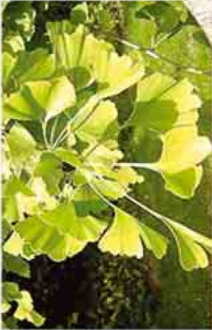
Günümüzdeki ginkgo yaprağı