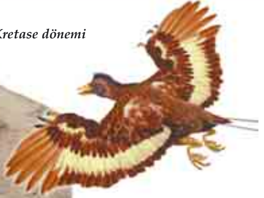
Confuciosornis'in temsili resmi (üstte)